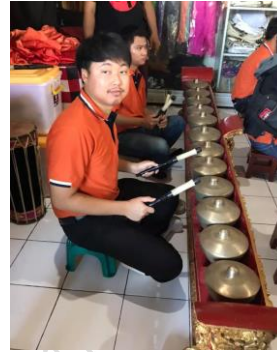
ภาพที่ 3 : BONANG (โบนาง)

ที่มา : ปฐมพงษ์ ธรรมลังกา ถ่ายเมื่อวันที่ 14 มีนาคม 2562 ณ เกาะบาหลี่