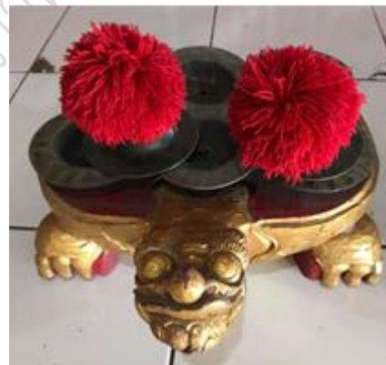
ภาพที่ 4 : Ceng Ceng (แก๊ง แก๊ง)