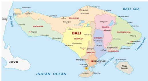
ภาพที่ 1: แผนที่เกาะบาหลิ ประเทศอินโดนีเซีย

บาหลีสื่อหนึ่งในจำนวนเกาะกว่าหมื่นเกาะของอินโดนีเซีย ตั้งอยู่ทางตะวันออกเฉียงของเกาะชวา ได้จากเส้นศูนย์สูตร 8 องศา มีฐานะเป็นรัฐ มีผู้ปกครองของตนเอง นอกจากนี้ยังเป็นเกาะสุดท้ายทางฝั่งตะวันออกเฉียงที่สภาพแวดล้อมเป็นแบบป่าฝนของเอเชีย เนื่องจากเกาะอื่นที่อยู่ถัดจากบาหลิไปจะได้รับอิทธิพลและมีลักษณะสภาพแวดล้อมเป็นแบบออสเตรเลียและนิวกินีบาหลิเป็นเกาะเล็กๆ ที่มีพื้นที่เพียง 5,620 ตารางกิโลเมตร บริเวณที่กว้างที่สุดมีระยะทาง 140 กิโลเมตร และบริเวณที่ยาวที่สุดก็เพียง 80 กิโลเมตรเท่านั้น แต่ภูมิประเทศของบาหลิกลับมีความหลากหลายมาก พื้นที่ทางตอนกลางนั้นมีภูเขาไฟซึ่งเป็นจุดสูงสุดที่สุดของเกาะและยังคงคุกรุ่นอยู่คือภูเขาไฟกุนุงอาุง (Gunung Agung) มีความสูงถึง 3,142 เมตร นอกจากภูเขาสูงแล้วยังมีป่าอุดมสมบูรณ์ พร้อมกับหาดทรายขาวละเอียดทอดแนวยาวไปตามชายฝั่ง ทางตอนใต้เป็นแหล่งปลูกข้าวบนนาขั้นบันได และทางตอนเหนือปลูกกาแฟ เครื่องเทศ และต้นสลัก