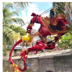
ภาพที่ 2 : วัดเบซากิ (Basaki) สถานที่ประกอบพิธีกรรมของชาวบาหลิ ที่มา : ปฐมพงษ์ ธรรมลังกา ถ่ายเมื่อวันที่ 14 มีนาคม 2562 ณ เกาะบาหลิ