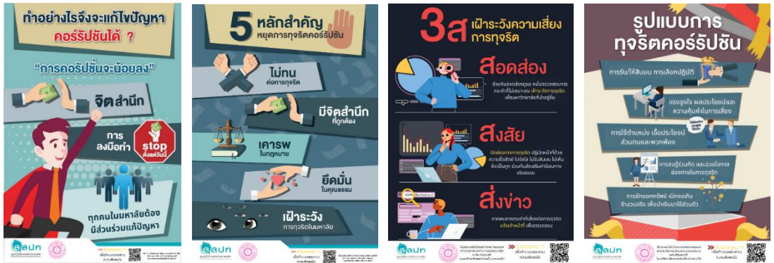
ภาพที่ 1 โปสเตอร์การณรงค์การต่อต้านทุจริต

ผลการดำเนินกิจกรรม พบว่า นิสิตมีความสนใจและเข้าถึงข้อมูลข่าวสารได้อย่างทั่วถึง โดยเฉพาะการใช้สื่อออนไลน์ซึ่งเป็นช่องทางที่สามารถกระจายข้อมูลได้อย่างรวดเร็วและมีประสิทธิภาพ ผลดังกล่าวสะท้อนให้เห็นว่า กิจกรรมรณรงค์สามารถสร้างการรับรู้และปลูกฝังจิตสำนึกด้านคุณธรรมและจริยธรรม ให้นิสิตเกิดความตระหนักในบทบาทของตนเองในฐานะสมาชิกของมหาวิทยาลัยและสังคม โดยนิสิตไม่เพียงแต่มีความรู้ความเข้าใจในหลักการต่อต้านการทุจริต แต่ยังเกิดทัศนคติที่ดี พร้อมทั้งจะมีส่วนร่วมในการสอดส่อง ดูแล และรายงานพฤติกรรมที่ไม่เหมาะสม